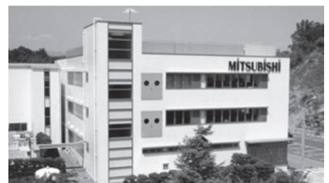
雷サージ試験サービス (埼玉県秩父郡横瀬町)

三菱マテリアル株式会社 電子材料事業カンパニー 電子デバイス事業部 営業部 MITSUBISHI MATERIALS CORPORATION ELECTRONIC MATERIALS & COMPONENTS COMPANY ELECTRONIC COMPONENTS DIV. SALES DEPT. TEL 03-5819-7322 / FAX 03-5819-7323 URL: http://www.mmc.co.jp/adv/dev/ Email: devsales@mmc.co.jp