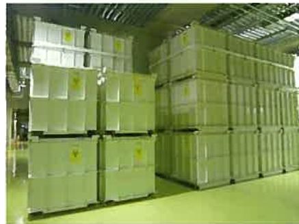
(地下1階の保管状況)