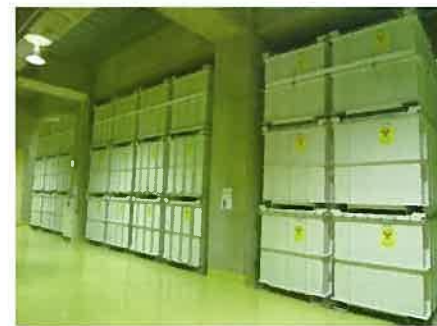
(地下2階の保管状況)