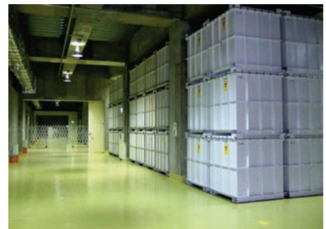
(地下2階の保管状況)