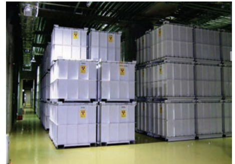
(地下1階の保管状況)