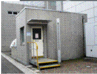
(新館東側の地下保管庫入口)