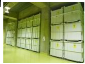
(地下2階の保管状況)