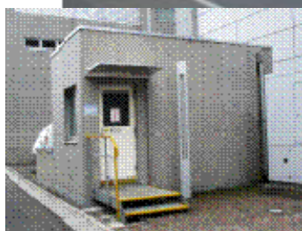
(新館東側の地下保管庫入口)