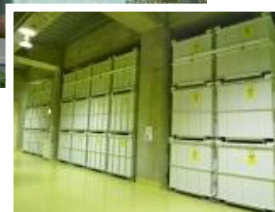
(地下2階の保管状況)