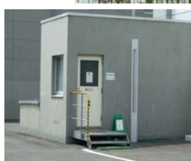
(新館東側の地下保管庫入口)