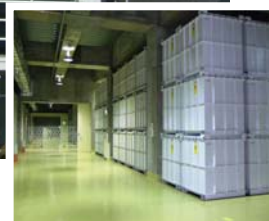
(地下2階の保管状況)