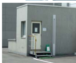
(新館東側の地下保管庫入口)