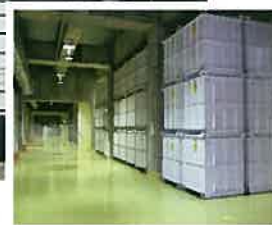
(新館東側の地下保管庫入口)