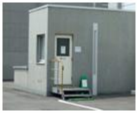
(新館東側の地下保管庫入口)