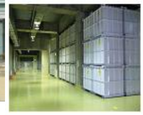
(地下2階の保管状況)